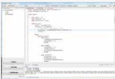
Entwicklungsumgebung für NanoJ V2

einem Quelltexteditor mit automatischer Code-Ergänzung, einem Compiler und einem Debugger besteht. Der Debugger erlaubt das Setzen von bis zu vier Breakpoints im Programm sowie das Auslesen der Variableninhalte an diesen Breakpoints. Da alle Funktionen des Plug & Drive Studios gleichzeitig genutzt werden können, kann man auch mit Hilfe des Objektverzeichnisses und des Oszilloskops das Verhalten der Steuerung während der Programmausführung nachvollziehen. So ist eine einfache und schnelle Programmierung kundenspezifischer Funktionen möglich.